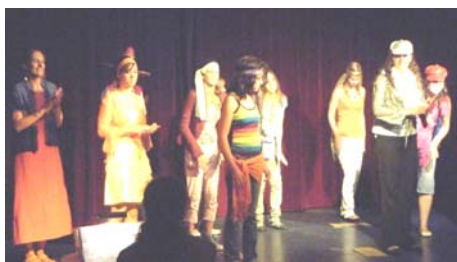
Le groupe de St Philbert de Grand-Lieu