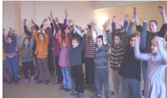
et « Viva la fiesta » ! pour nos artistes lorrains !