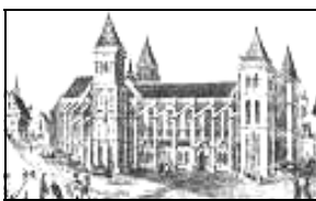
St Martin de Tours

Outre le salaire fixe et les gratifications occasionnelles, les musiciens de ces chapelles prestigieuses jouissaient d'une forme de pension de retraite avant la lettre par l'obtention de prébendes, un bénéfice ecclésiastique leur garantissant ainsi une fin de vie à l'abri du besoin. Ces prébendes équivalaient à des postes rémunérés comme chapelain, doyen, charges honorifiques et sans obligation de résidence.