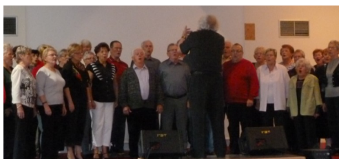
Le Chœur d'Or